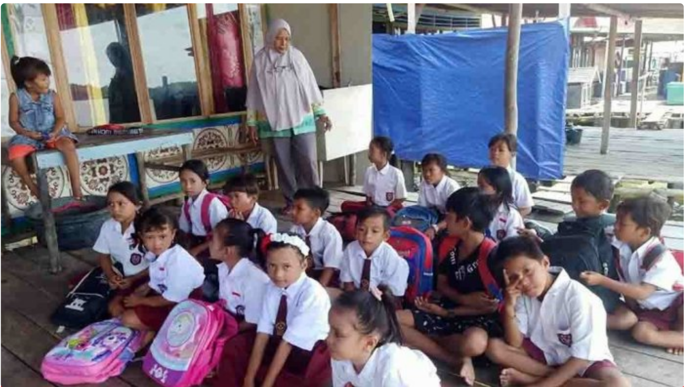
Pengabdian Seorang Guru di Desa Terpencil

LAMPUNG - Peringatan hari guru tahun ini semoga menjadi momentum yang tepat dan strategis untuk menatap masa depan pendidikan Indonesia yang lebih baik. Tantangan dan masalah yang sedemikian kompleks membutuhkan pemikiran yang mendalam. Guru sebagai garda terdepan harus terus menerus berbenah diri untuk mencerdaskan kehidupan bangsa. Pun negara harus hadir memperbaiki taraf hidup guru khususnya bagi guru honorer yang berada di